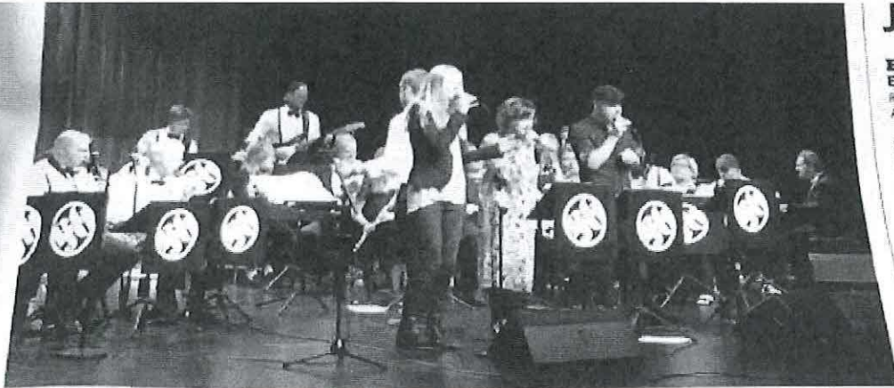
Jublande gospel i storbandsversion med flitiga solister förtjuste publiken i Hässleholm Kulturhus.